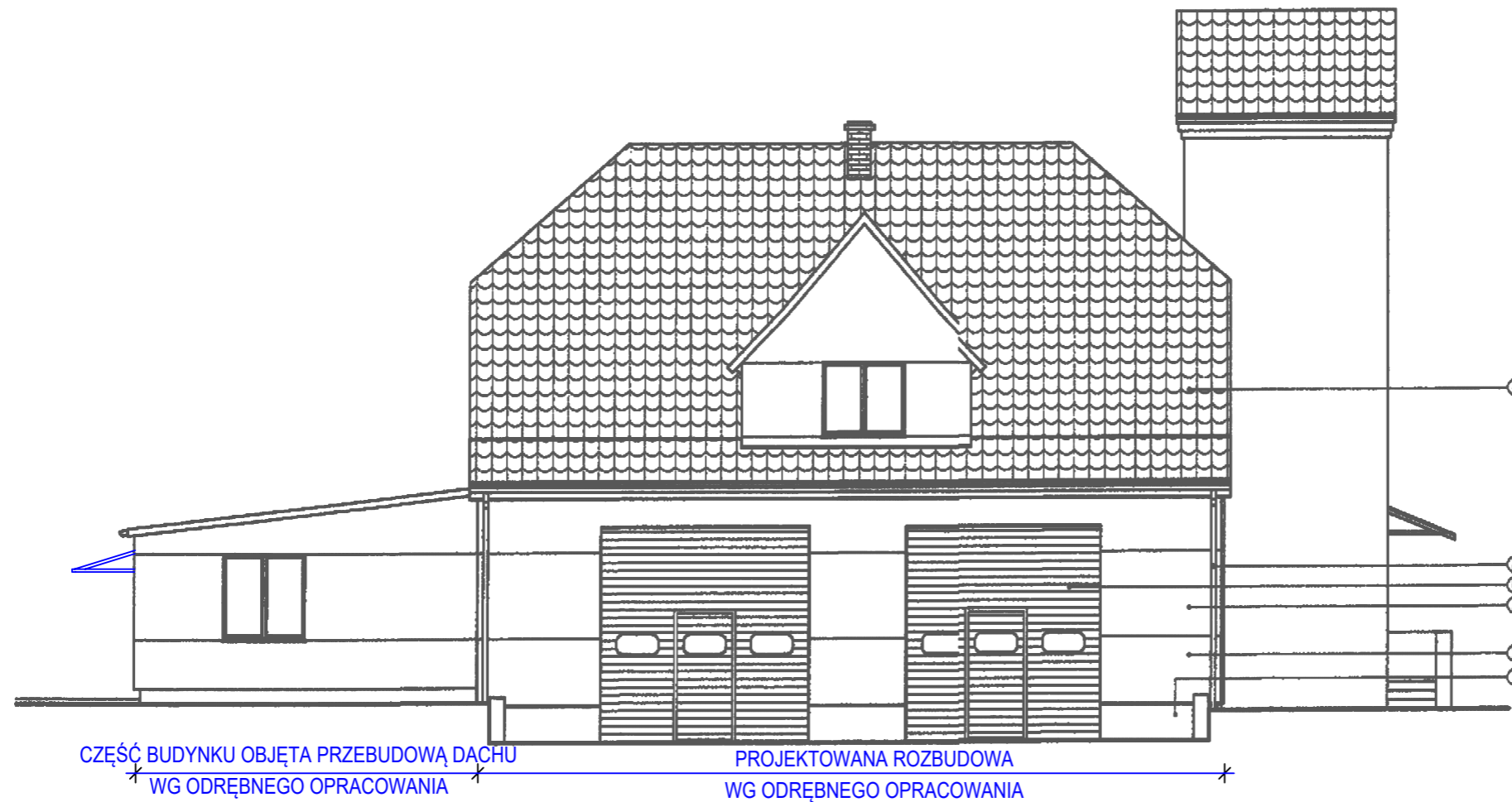
elevacja północno - zachodnia