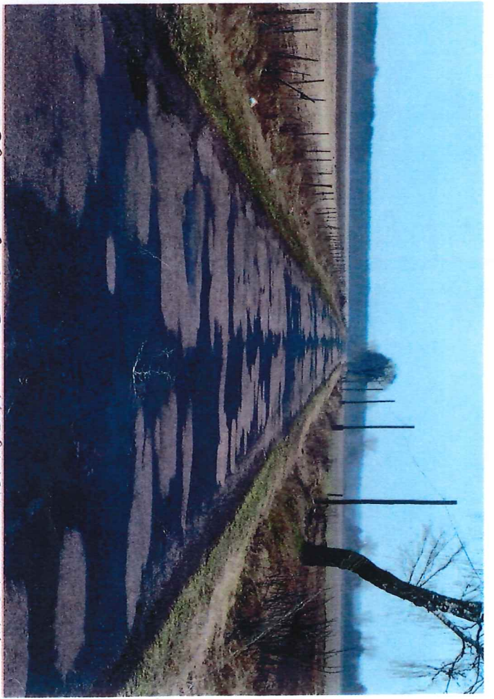
DROGA 2007 2 - KIERUNEK WIELBOKI