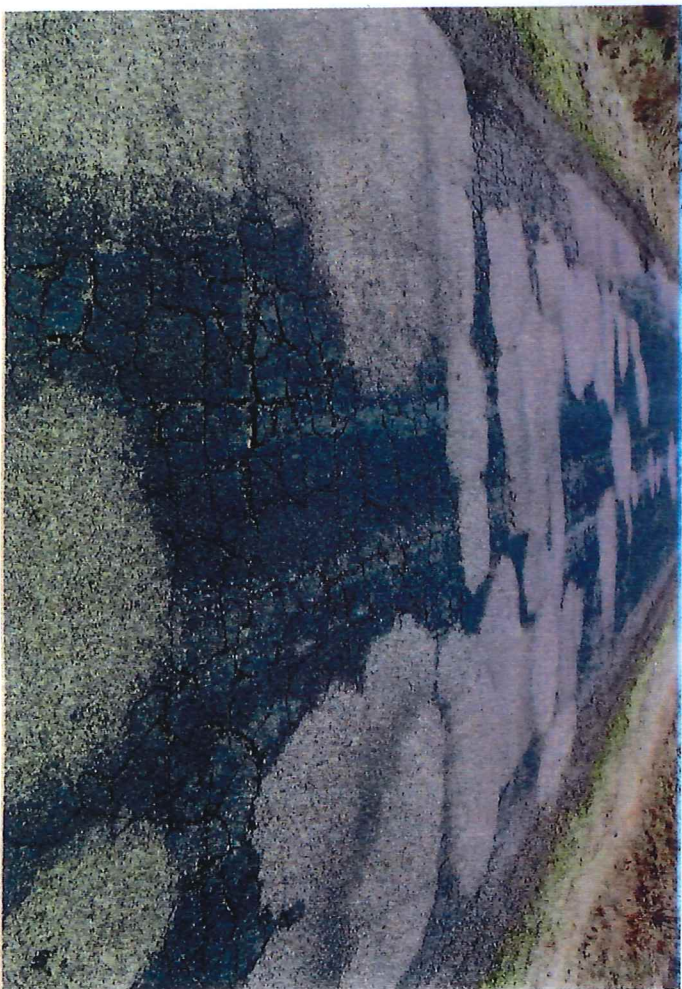
DROGA 2007 2